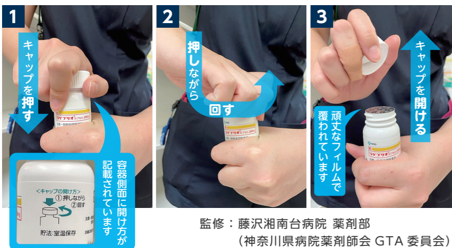
図3 ラゲブリオ容器の安全キャップ(チャイルド・ロック式)の開け方

藤沢湘南台病院では、発熱診療を実施しています。医師は必要に応じて、 治療薬を処方します。今回は、主に外来で処方される新型コロナウイルス 治療薬のうち、抗ウイルス剤ラパキロビッドパック(以下、パキロビッド)、 ゲブリオカプセル(以下、ラゲブリオ)について紹介します。