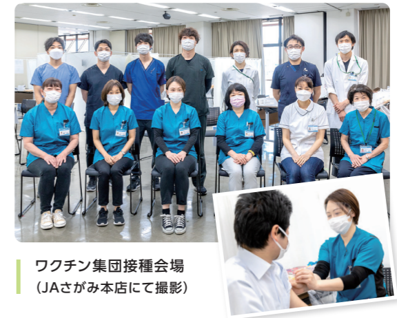
ワクチン集団接種会場 (JAさがみ本店にて撮影)

国内で使用されているワクチンは、主にmRNAワクチンと呼ばれるものに変換されることはないため、子孫の遺伝や自身の遺伝子に影響はありません。また、不妊を否定する論文も発表されています。ワクチン接種の目的は、感染防止ではなく、重症化の防止や感染時の免疫暴走の予防です。関東地方における累積死亡者数と累積死亡率の結果から、ワクチン接種による重症化の防止効果が確認されました。ワクチンの主たる副反応は、注射部位の痛みや腫れ、発赤、リンパ節の腫脹等です。また、発熱や倦怠感、頭痛、