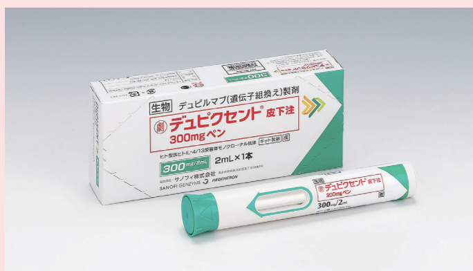
図1 デュピクセント製剤

2018年に登場したアトピー性皮膚炎治療薬としては初の生物学的製剤（生物から産生されるタンパク質などを応用して作られた薬剤）です。(▼図1)